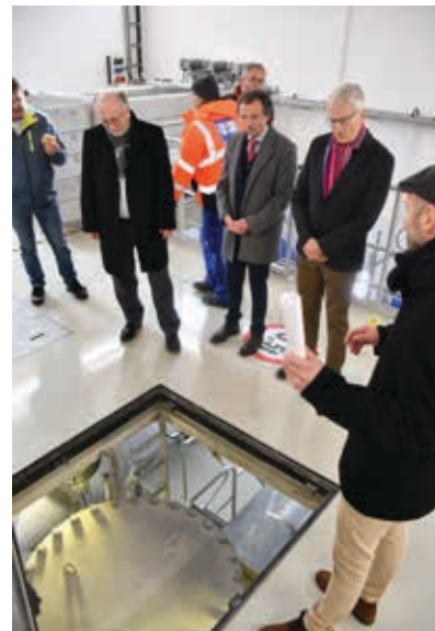
Bei der offiziellen Inbetriebnahme gab es auch einen kurzen Einblick in die Arbeitsweise des Schöpfwerkes - hier speziell in den Pumpenbereich.

Das Schöpfwerk sei ein wichtiger Baustein für den Hochwasserschutz in Sömmerda, unterstrich der Bürgermeister. Die Problemlage, dass der Altstadtbereich bei anhaltenden und kräftigen Niederschlägen überschwemmt wird, habe bereits lange bestanden. Mit dem Schöpfwerk sei dem etwas entgegengesetzt worden. Zudem