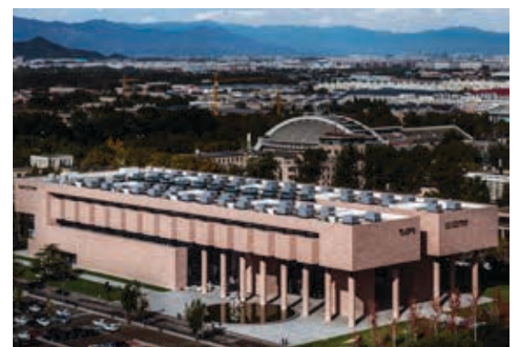
Das Tsinghua University Art Museum in Peking, wo der PC 1715 bald gezeigt wird.