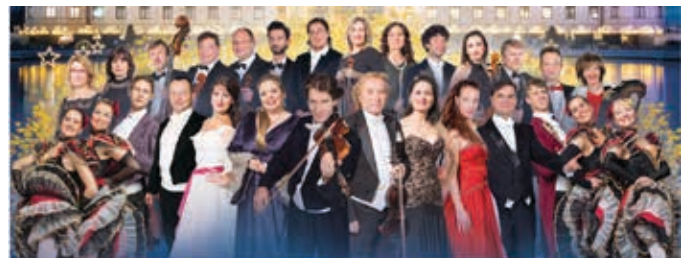
Mitglieder des Gala Sinfonie Orchesters Prag, Solisten und Ballett